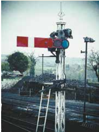
Дорожные знаки За безопасность движения отвечала стража

Е динственным сигналом, поначалу использовавшимся на Царскосельской железной дороге, был паровозный свисток. Но движение поездов на первой российской магистрали становилось всё оживлённее. Пришла пора регулировать движение. На дороге для извещения о движении поезда был устроен оптический телеграф. Это были высокие столбы, на вершину которых днём поднимали чёрные шары, а ночью – красные фонари. Позже